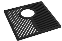
Gitter Black 8100 651